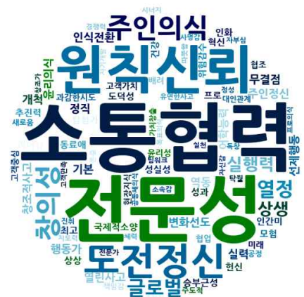
〈그림1〉 2018년 100대 기업 인재상

‘열정’ 33개사, ‘글로벌역량’ 31개사, ‘실행력’ 22개사 등의 역량은 그 뒤를 이었다.